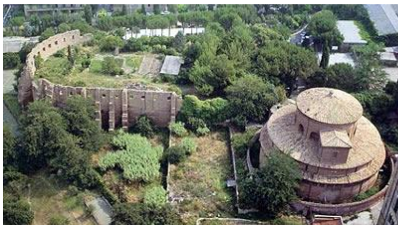
il mausoleo e i resti della basilica

La tomba di Costanza era un sarcofago di porfido rosso, oggi nei Musei Vaticani.