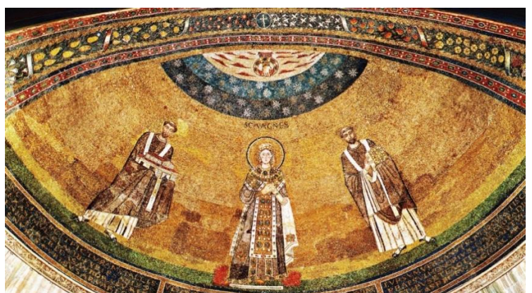
il mosaico nell'abside

Dalla basilica si scende nella cripta e nella cataomba.