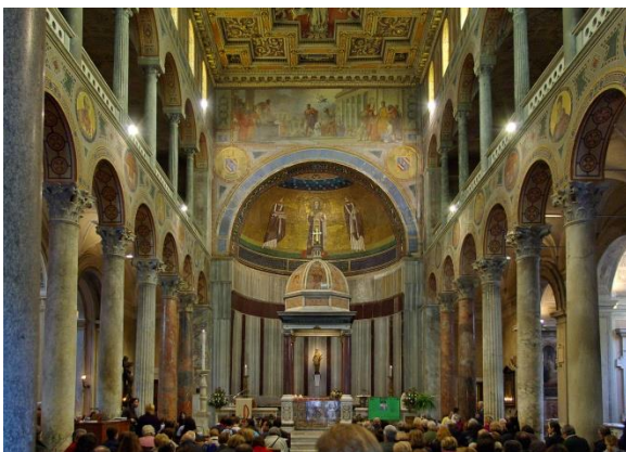
l'interno della basilica

Nell'abside c'è l'opera più preziosa e più antica della basilica, il mosaico che raffigura Sant'Agnese e i papi Simmaco ed Onorio (625-638).