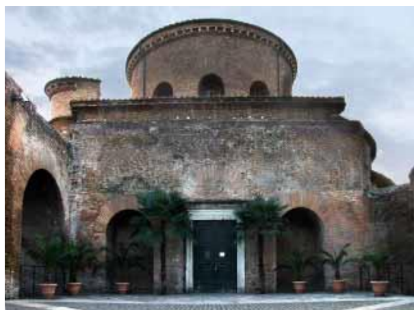
la facciata del mausoleo

Il mausoleo si trova dentro il complesso di Santa Agnese.