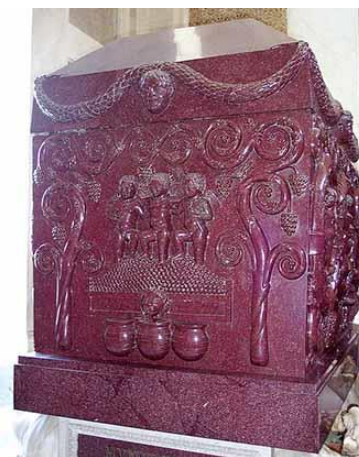
sarcofago di Costanza

Il mausoleo è stato trasformato in chiesa nel 1254.