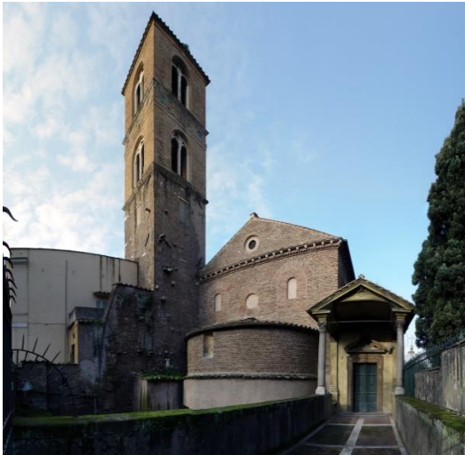
l'abside e il campanile